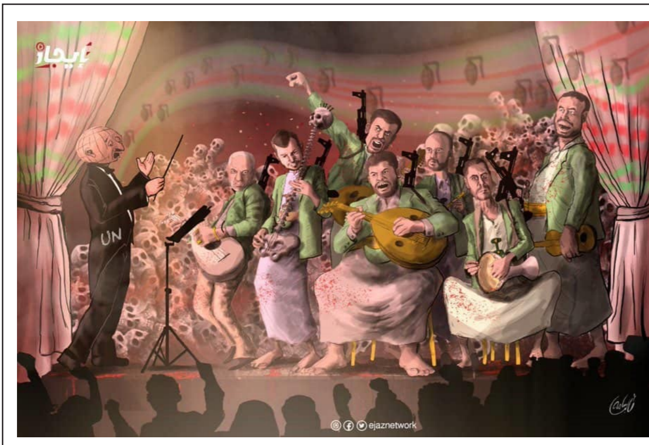
كاريكاتير معروفة الموت